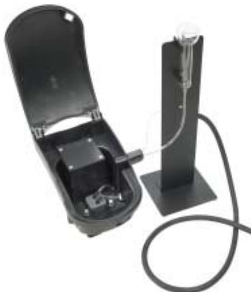
Kit de celdas Pour-Thru™