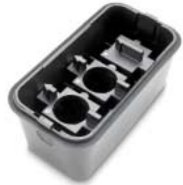
Cubierta protectora para guardar los adaptadores