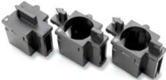
Adaptadores de celda A, B, C