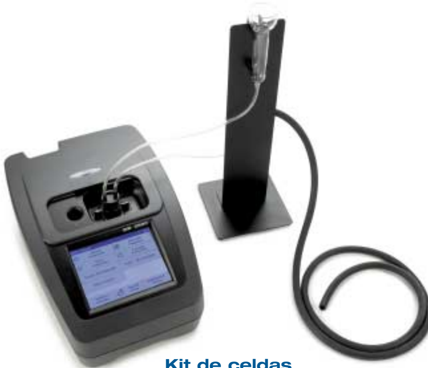
Kit de celdas Pour-Thru™