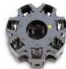
Carrusel porta celdas