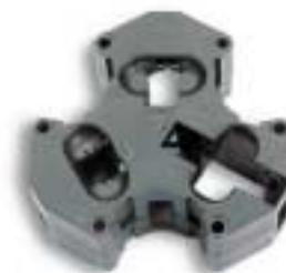
Porta celdas múltiple