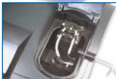
Modulo de aspiración de muestras