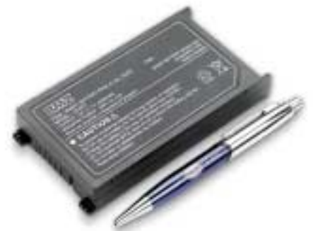
Batería de litio